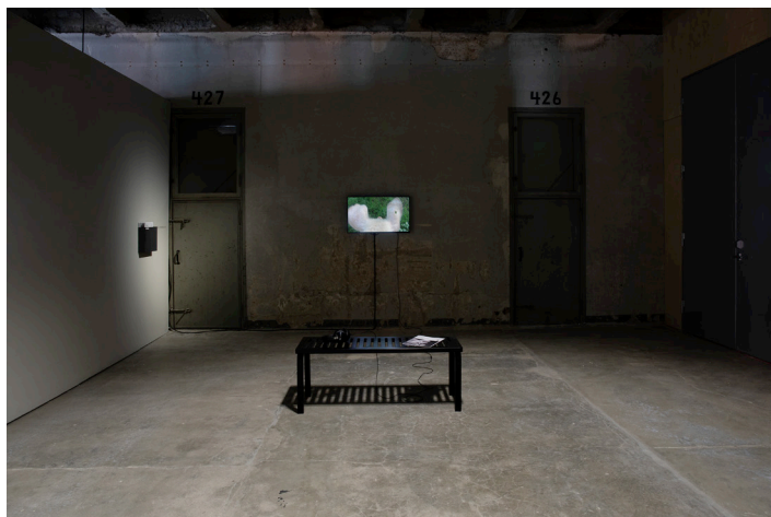
Nimetön – Alive. Upphovsrätt: Jenni Latva. Med tillstånd av Kunsthalle Seinäjoki.

Att reflektera över djur som den människostyrda organiseringens föremål för organisering eller objekt kan även få oss att problematisera systematiskt, institutionaliserat våld, och hur vi förhåller oss till djur på produktionsanläggningar. Frågan modern djurproduktion är i högsta grad en fråga om organisering – instrumentell och tayloristisk sådan – där vi ofta som konsumenter väljer att blicka bort snarare än att aktivt ta ställning till problematiken. I dag präglas vårt förhållningssätt till uppfödda produktionsdjur, så som grisar, kor eller höns, ofta av ett rumsligt och emotionellt avstånd, helt enkelt för att den industriella köttproduktionen är dold för de allra flesta av oss. Kognitiv dissonans hänvisar till motstridiga resonemang och en slags förnekelse av djurens lidande. Samtidigt vet vi att människors utnyttjande av andra djur medför negativa hälsoeffekter också på oss människor (Crary och Gruen 2022). Inom vinstdriven industriell djurhållning som opererar enligt produktionslogiken positioneras levande djur paradoxalt nog som resurser eller icke-djur, fränkopplade både oss människor men också helt avskiljda från sina egna naturliga, affektiva världar. Den övergripande målsättningen blir då att utnyttja till exempel grisar, kor, höns eller laxar så kostnadseffektivt som möjligt. Detta organiserade lidande och det moraliskt, etiskt och fysiskt smutsiga arbete som det samtidigt innebär, har till viss omfattning studerats (Baran et al. 2016;