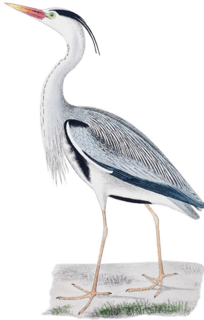
Gråhäger. Ur Magnus Körner, Skandinaviska foglar (Lund, 1841–42).

Upplysningsfilosofen och naturforskaren Georges-Louis Leclerc de Buffon menade på 1700-talet i ett berömt men knappast rättvisande porträtt av hägern – i hans tolkning kanske den mest ensamma, melankoliska, lidande, ängsliga och av naturen vanlottade fågeln av alla – att när den gjorde så kunde man undra om det verkligen var en levande varelse man såg. Enligt honom berodde beteendet på en konstitutionell oföretagsamhet, som var så förlamande att det hände att den arma fågeln ofta helt enkelt svalt ihjäl.