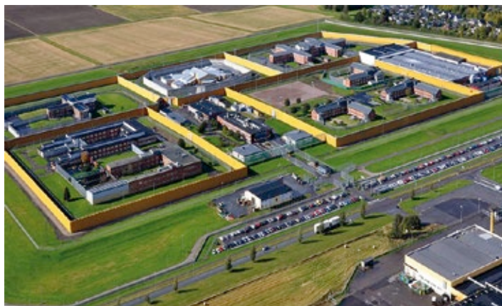
Kumlafängelsets kloster var verksamt mellan 2001 och 2018.

intagna som är intresserade av den långa reträtten har ett samtal med reträttledaren, för att se om det finns tillräckligt med motivation och allvar bakom deltagandet. En deltagare i reträtten måste ha minst fyra straffår. Kvinnliga intagna erbjuds en 10-dagars reträtt och andra former av icke-andliga reträtter (Carlsson 2010). Utöver deltagarna finns tre personer i klostret – reträttledaren, reträttledarassistenten och klostervärden. Medan assistenten och värden sköter det praktiska tar ledaren ansvar för att genomföra individuella dialoger med deltagarna under fem dagar varje vecka. Resten av tiden är deltagarna isolerade och ägnar sig främst åt att läsa Bibeln.